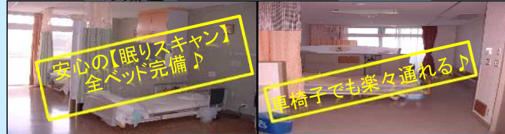
㈱酒井医療製 パンジー