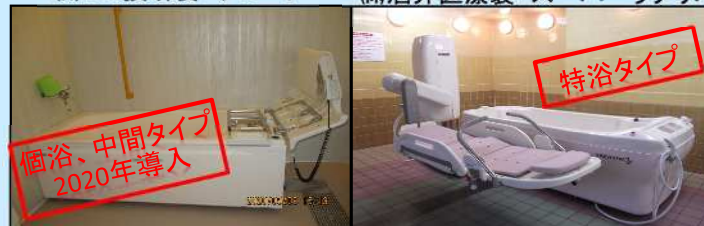
㈱酒井医療製 スーパーラダリバス