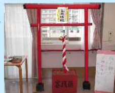
元日は、華郷神社でお参り