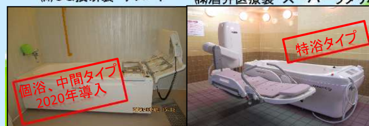
(株)酒井医療製 スーパーラダリバス