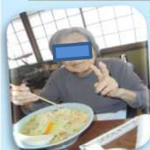
出前イベント タンメン美味しかった～。