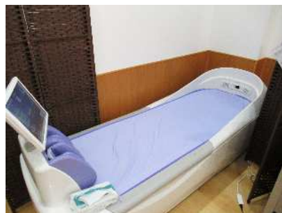
ウォーターマッサージベッド 2台

身体の筋力低下などの機能の維持向上や残存能力の活用を目的として行う訓練を柔道整復師の指導の元、お受け頂きます。